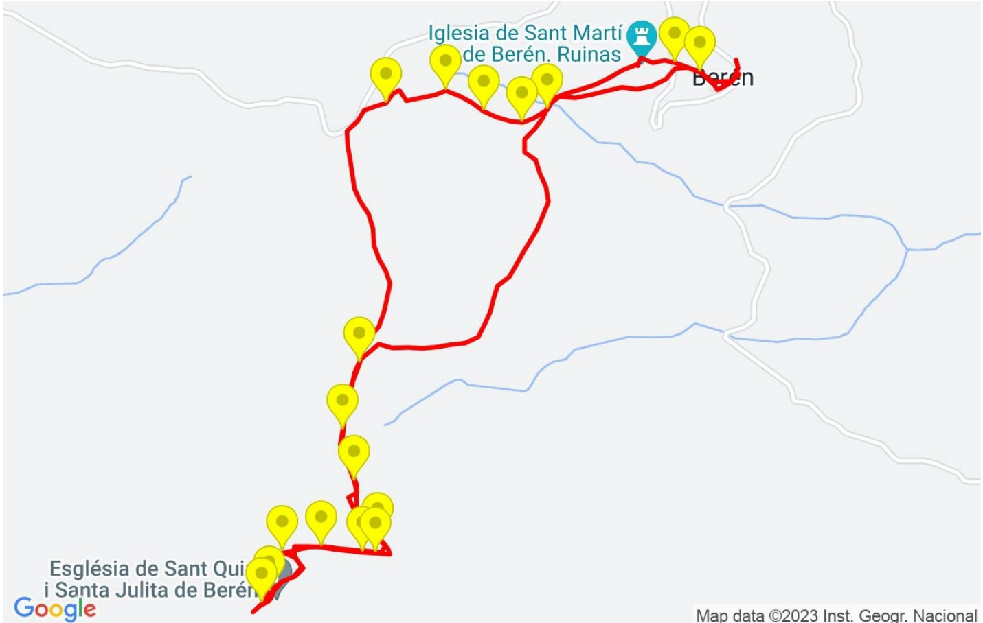
Map data ©2023 Inst. Geogr. Nacional